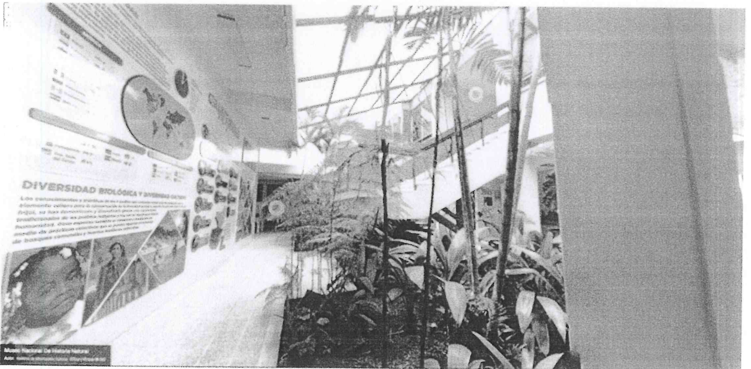
3. Integración de Plugin para la agenda cultural de la nación.